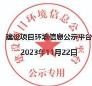
图 2 项目第二次网络平台公示照片