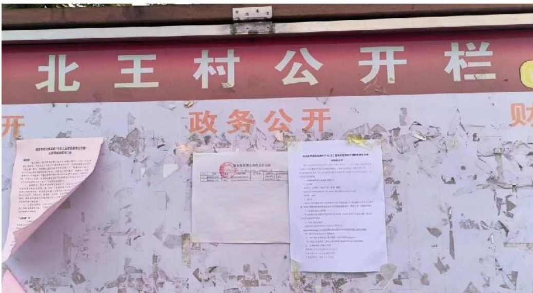
图 5 现场张贴公示照片