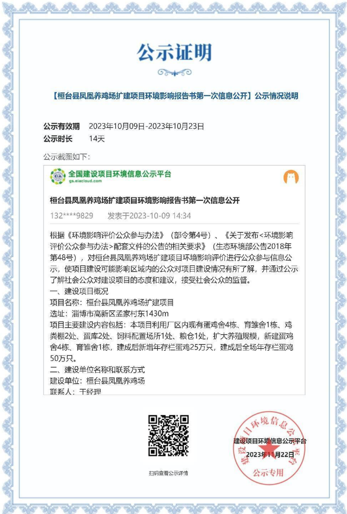
图 1 项目第一次公示照片